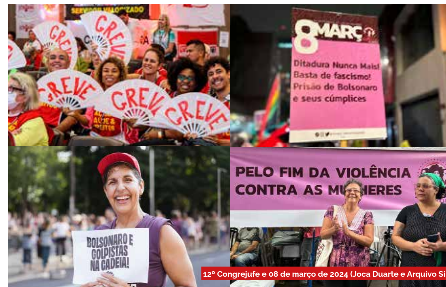
12º Congrejufe e 08 de março de 2024

ximação interpessoal, a relação acontece de forma natural e respeitosa. Se não houver consentimento expresso, pare. Se continuar, é violência.