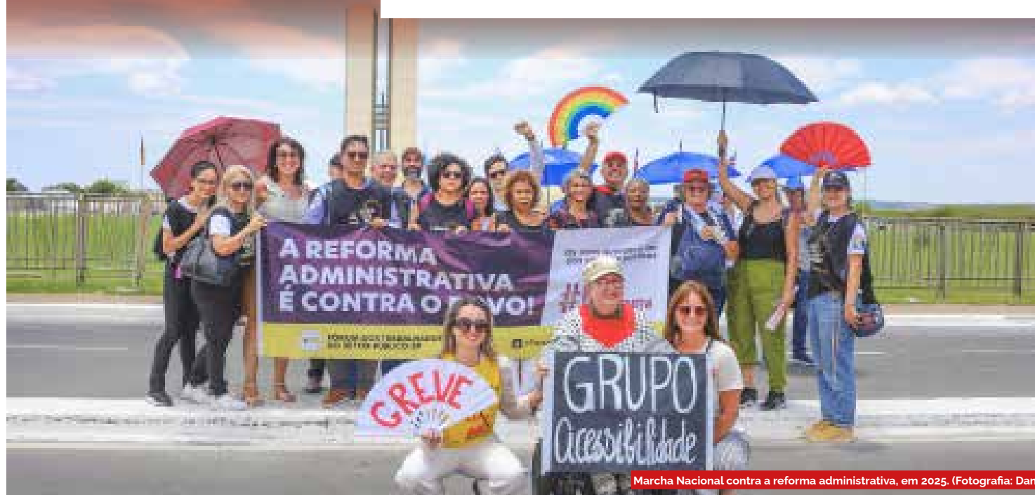
Marcha Nacional contra a reforma administrativa, em 2025.

lógicas, morais, sexuais e patrimoniais. A Convenção 190 impõe aos países signatários a obrigação de prevenir, combater e reparar situações de violência e assédio no trabalho, afirmando que ambientes de trabalho seguros e dignos são condição fundamental para a justiça social e para a proteção da saúde física e mental de trabalhadoras e trabalhadores.