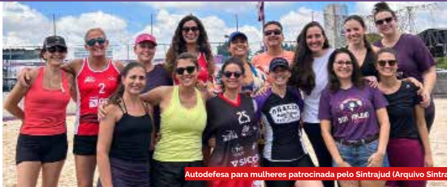
Autodefesa para mulheres patrocinada pelo Sintrajud

2 Sim, o assédio sexual também acontece com homens. Mas uma pesquisa realizada no Brasil, em 2015, pelo site vagas.com apontou que 80% das pessoas que relataram já ter sofrido assédio no trabalho são mulheres. A pesquisa ouviu 4.975 mil profissionais de todas as regiões do país.