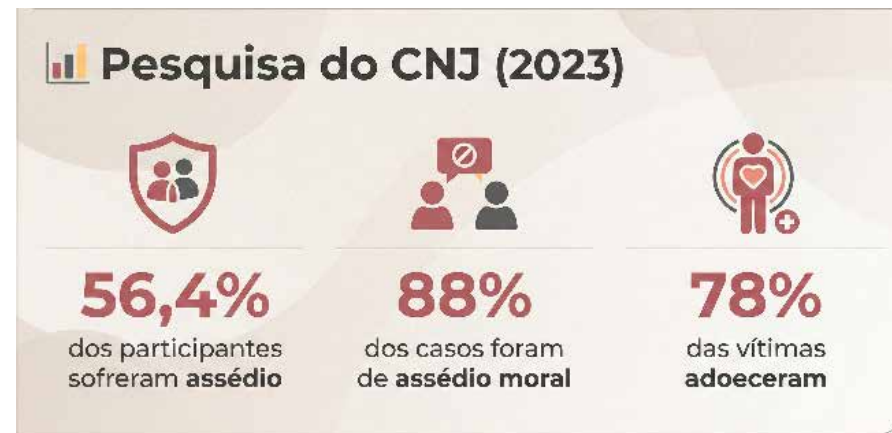
(Fonte: Assédio e discriminação no âmbito do Poder Judiciário/CNJ, 2023)

gestão que violam a dignidade no trabalho. O impacto sobre a saúde é devastador: 78% das vítimas desenvolveram adoecimento.