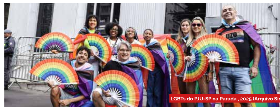
LGBTs do PJU-SP na Parada, 2025

Embora todas as mulheres estejam sujeitas a vivenciar situações de assédio sexual, é fundamental destacar que mulheres negras, indígenas e pessoas LGBTQs se encontram em condição de maior vulnerabilidade. Tal circunstância decorre de um contexto histórico marcado pelo racismo estrutural que fundou a sociedade brasileira no processo de colonização e escravidão, o qual construiu estereótipos que hipersexualizam esses corpos femininos, favorecendo sua objetificação e tornando essas mulheres alvos ainda mais frequentes desse tipo de violência.