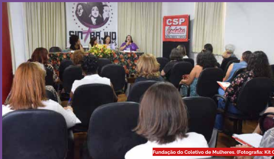
Fundação do Coletivo de Mulheres.

sejam plenamente respeitadas e não sofram constrangimentos no exercício funcional. Contamos com o seu retorno para sabermos o que avaliou deste material e que sugestões você tem para fortalecer a ação sindical neste tema tão caro a nós mulheres cis ou transgêneras.