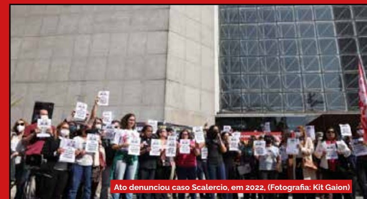
Ato denunciou caso Scalercio, em 2022.