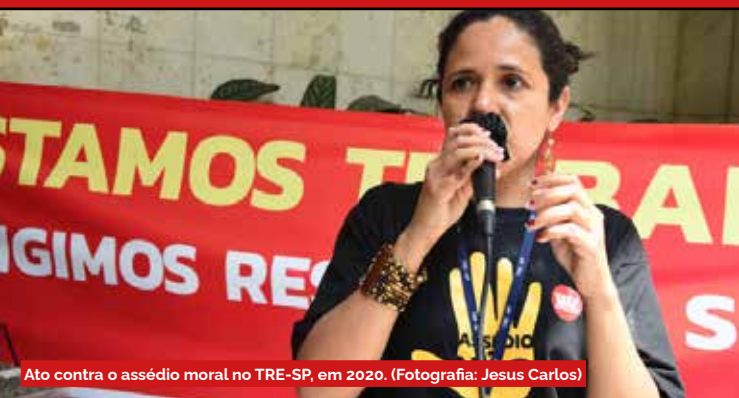
Ato contra o assédio moral no TRE-SP, em 2020.

assinaturas e respaldo de entidades nacionais e internacionais, culminou na anulação da demissão pelo CJF-3 em fevereiro de 2023. Uma vitória coletiva que mostrou a força da organização da categoria.