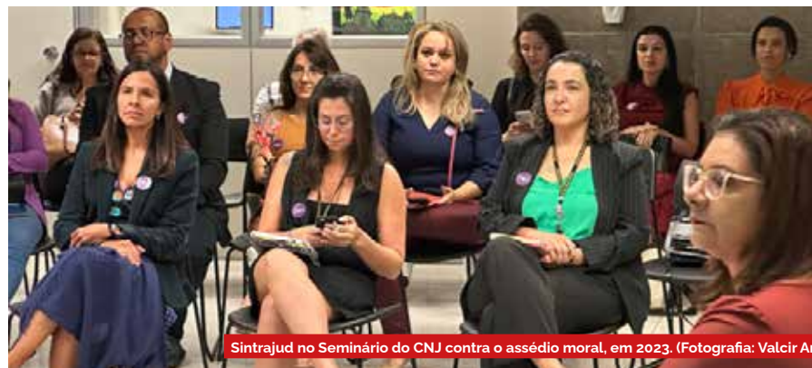
Sintrajud no Seminário do CNJ contra o assédio moral, em 2023.

Se respondeu ‘sim’ a pelo menos três dessas questões em relação a um mesmo autor, você está sendo vítima de assédio sexual no trabalho.