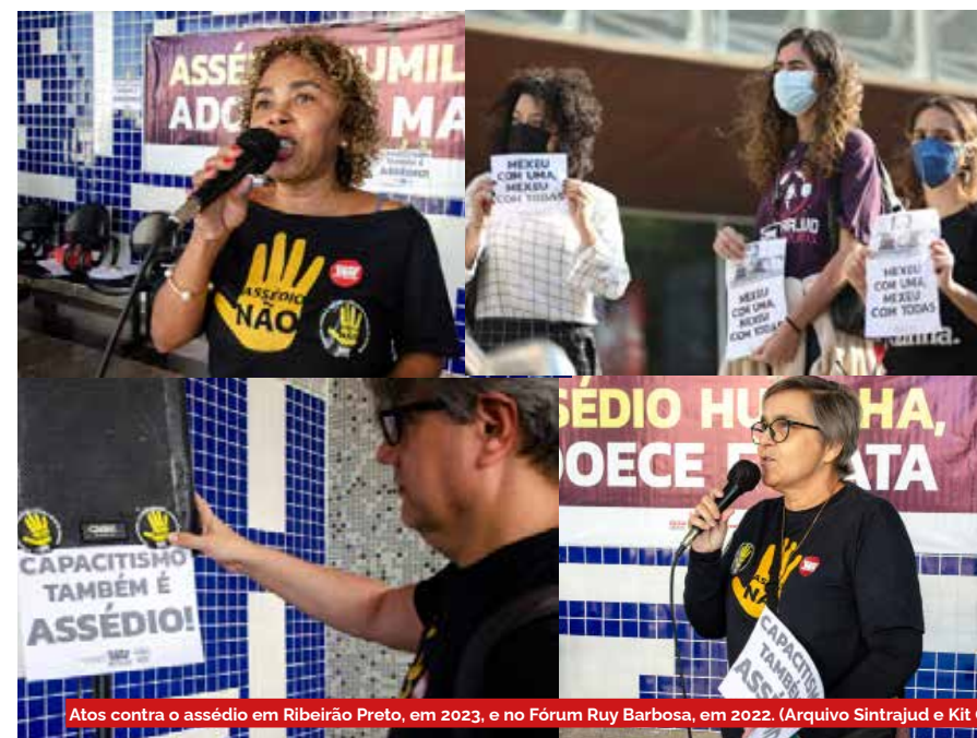
Atos contra o assédio em Ribeirão Preto, em 2023, e no Fórum Ruy Barbosa, em 2022.

Procure o Sindicato para agir coletivamente e garantir nossos direitos. Um ambiente de trabalho saudável só é possível quando práticas de assédio são denunciadas, combatidas e prevenidas.